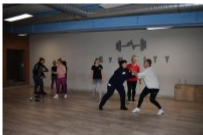
zajęcia z samoobrony dla kobiet

Kobiety były zainteresowane obiema częściami zajęć i brały w nich czynny udział.