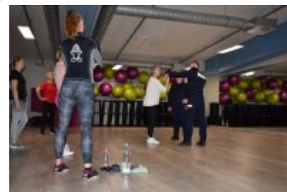
zajęcia z samoobrony dla kobiet