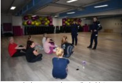
zajęcia z samoobrony dla kobiet