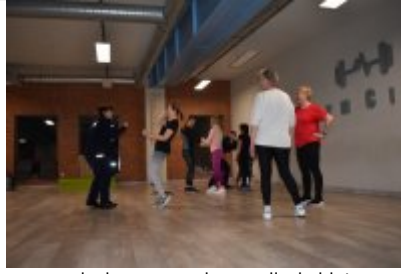
zajęcia z samoobrony dla kobiet