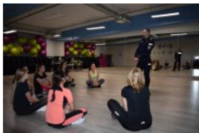
zajęcia z samoobrony dla kobiet