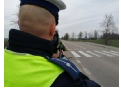
policjanci w trakcie działań pn. "Kaskadowy pomiar prędkości"