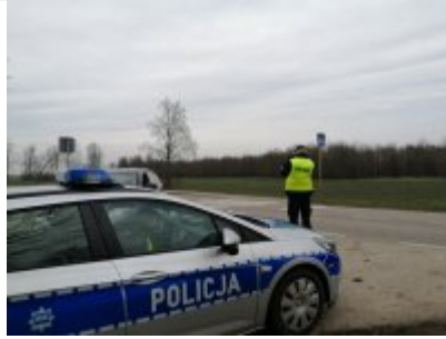
policjanci w trakcie działań pn. "Kaskadowy pomiar prędkości"