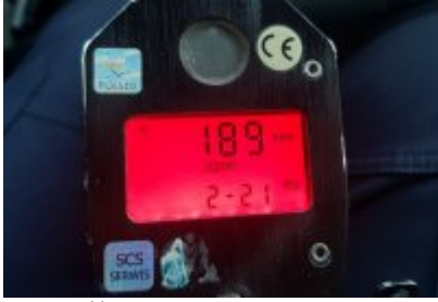
prękość z jaką jechał oplem 19 - latek