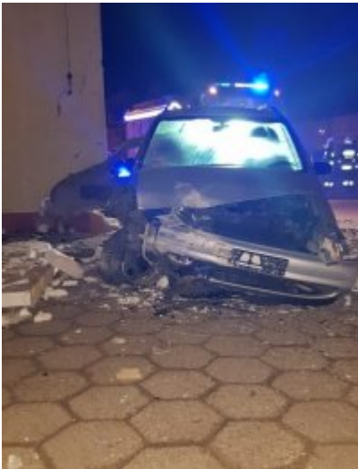
miejsce zdarzenia drogowego, które spowodowała pijana 17 - latka