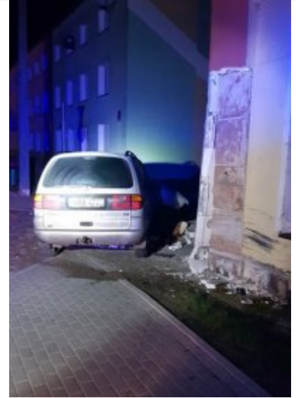
miejsce zdarzenia drogowego, które spowodowała pijana 17 - latka