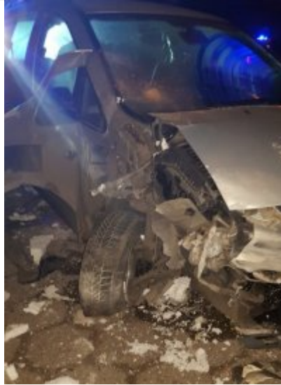
miejsce zdarzenia drogowego, które spowodowała pijana 17 - latka